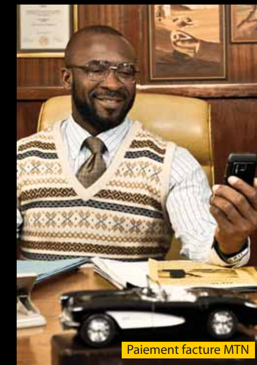
Paiement facture MTN