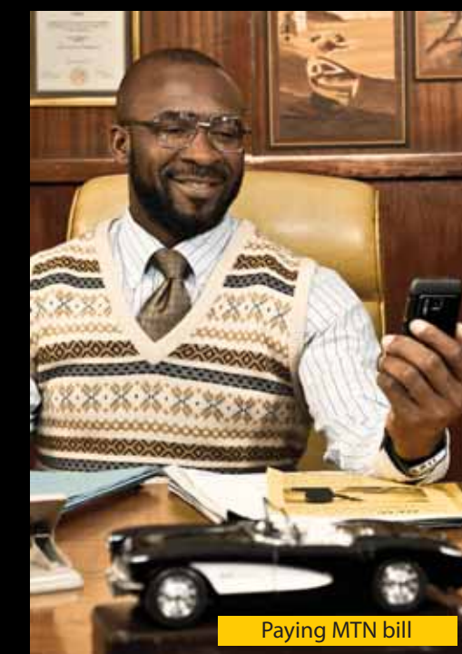
Paying MTN bill