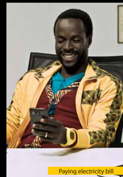
Paying electricity bill